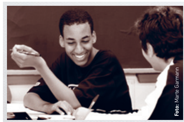
Forkurs sikrer at mange av elevene får en tryggere skolestart enn de ellers ville ha fått.

Et sentralt satsingsområde for skolen har vært å legge til rette for at foreldre og foresatte får informasjon på sitt morsmål. Skolen laget i første del av prosjektet en brosjyre om foreldre-