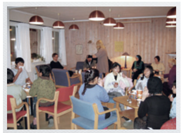
Språkkvelden avsluttes med hygge og sosialt samvær.

I februar 2011 var personalet ved Verdensmester'n på besøk hos Fjell skole. Personalet fikk informasjon og samtalte om stasjonsundervisning og mottak av nyankomne minoritets-språklige elever ved Fjell skole.