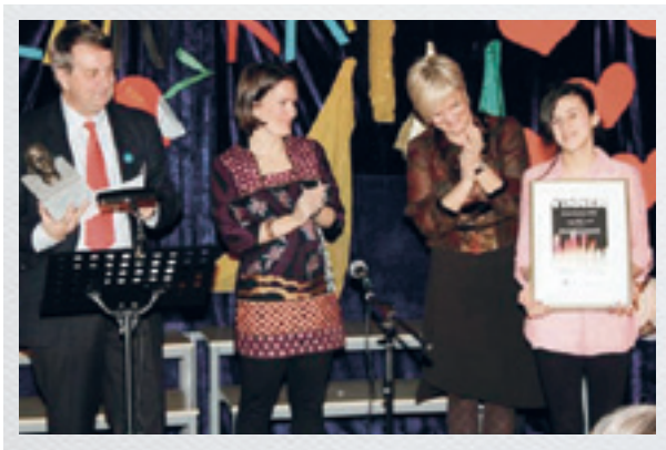
En stolt rektor og elevrådsleder mottar Benjaminprisen i januar 2011

og kjenne til gjensidige krav i samarbeidet mellom hjem og skole. Prosjektets tittel viser målsettingen om økt engasjement og deltakelse fra foresatte fra språklige minoriteter i utviklingen av egne barn, klasse miljøet og skolemiljøet. Et gjennomgående tiltak har altså vært språkhomogene foreldremøter for de største språkgruppene på skolen. Dette har vært gjort i mange år for den store somaliske foreldregruppen. Det var noen av de somaliske mødrene som tok initiativet til slike møter allerede i 2004. Og siden har skolen hatt jevnlig møter med denne foreldregruppen. I prosjektet har en utvidet til flere språkgrupper. Kommunikasjonen foregår stort sett på morsmålet, med tospråklige lærere. Viktige skolerelaterte tema har vært knyttet til sammenligning av skolesystemer og barneoppdragelse, betydningen av foreldremedvirkning og hva foreldre kan bidra med i praksis. En har her også diskutert praktisk-estetiske fag, uteskole, RLE, religiøse høytider. Språk og språkutvikling, betydning av morsmål opp mot læring av norsk har også vært viktige tema. I prosjektperioden har en satset på å holde ett til to språkhomogene foreldremøter i året. I tillegg har en holdt ett til to store foreldremøter i året for alle foreldre med tema "Foreldremedvirkning og foreldreengasjement, hvordan kan foreldre utgjøre en forskjell?" Et eget tiltak innenfor foreldrearbeidet har vært å satse på