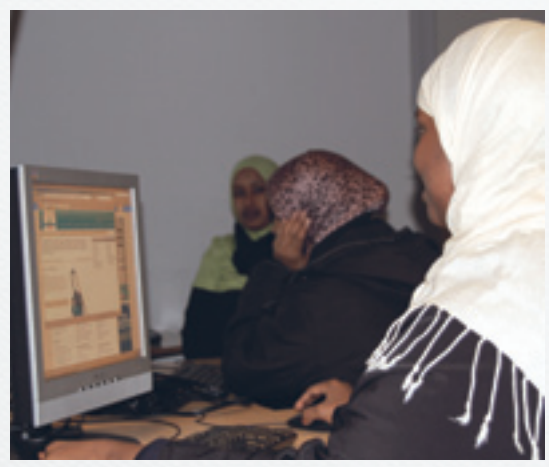
Fronterkurs for minoritetsforeldre på Tøyen skole