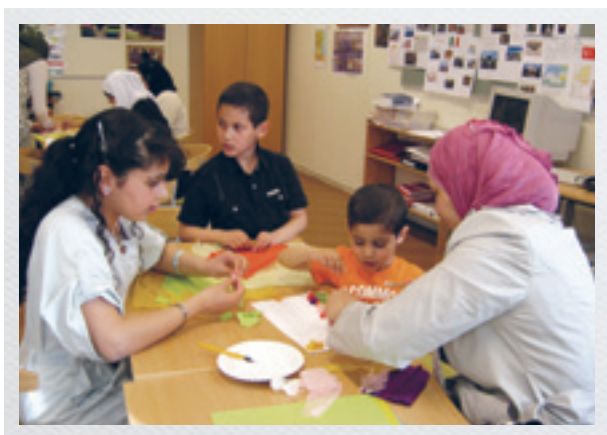
Høy aktivitet på formingsstasjonen.

Data: Her presenteres pedagogisk programvare og skolens hjemmeside. Foreldre og barn jobber sammen og prøver ulike pedagogiske programmer og blir kjent med skolens hjemmeside. Lærerne viser hvor ulike planer og læringsressurser ligger.