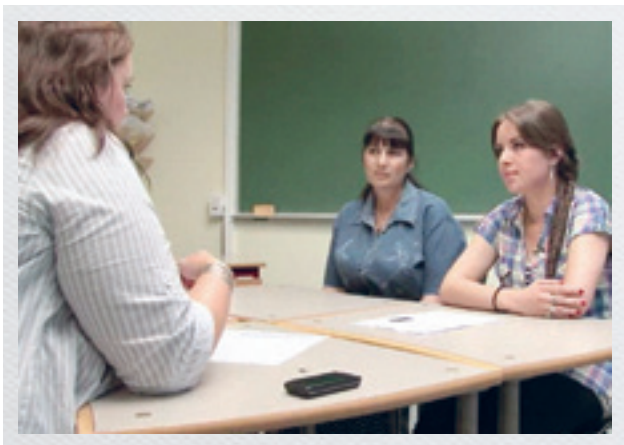
Møte første skoledag mellom elev, foresatte og kontaktlærer.

Målgruppe for prosjektet har vært alle foresatte og elever i skolens Vg1 klasser, og som hovedmål har skolen hatt at