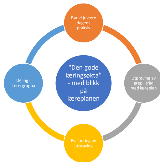
Figur 1: Aksjonslæring i det lokale utviklingsarbeidet (basert på ekspansiv læring i skolen, etter Aas, 2013 s. 52; Fondevik, 2021)

I prosjektet definerte lærerne kjennetegn ved en god læringsøkt. Med utgangspunkt i «den gode læringsøkta» har aksjonslæringsrundene i utviklingsarbeidet blitt organisert i fire ukers sykluser. Lærerne drøftet og vurderte behov for å justere dagens praksis slik at den ble i samsvar med læreplanen. Deretter ble lærerne enige om hva og hvordan ny praksis kunne prøves ut. Etter utprøving ble det satt av tid til refleksjon og evaluering av utprøvingen i team. Til sist ble det lagt til rette for faste økter med erfaringsdeling fra aksjonsrundene på fellesmøtene.